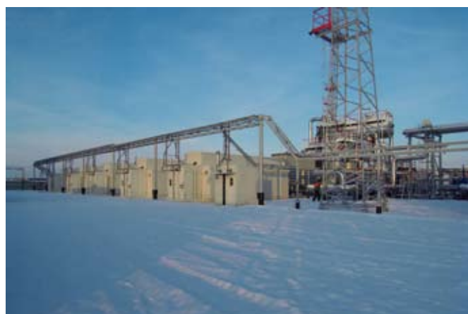
Фото 1. Компрессорная станция Enerproject на Алехинском месторождении (ОАО «Сургутнефтегаз»)