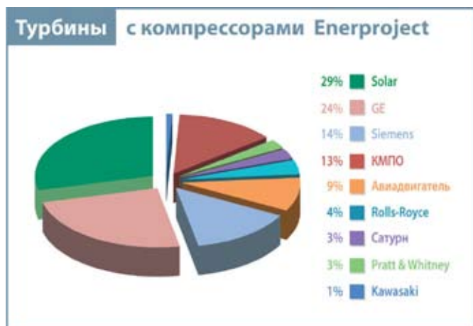
Рис. 1. Турбины с компрессорами Enerproject

ДКУ ENERPROJECT используются как в составе газотурбинных электростанций для компримирования ПНГ и подачи топливного газа в турбины (рис. 1), так и непосредственно для перекачки попутного газа по трубопроводам. В наших дожимных компрессорных установках, работающих на попутном газе, реализован целый ряд эффективных инженерных решений, которые учитывают назначение ДКУ и особенности эксплуатации.