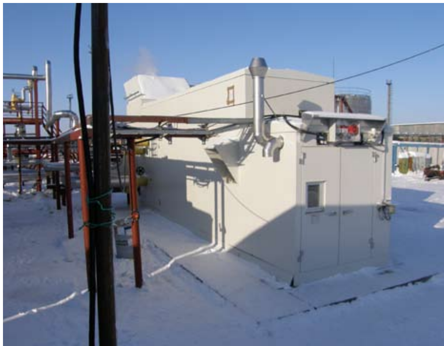
Фото 3. Блочно-модульная ДКУ (Быстринское месторождение)

Камынского, Мурьявинского, Юкьявинского, Тромьеганского, Северо-Лабатьюганского, Верхне-Надымского, Западно-Чигоринского, Тевлинско-Рускинского, Ватьеганского, Рогожниковского месторождений (фото 2). Шесть дожимных компрессорных установок обеспечивают ГТЭС Талаканского месторождения, расположенного в Якутии и имеющего большое значение для эксплуатации нефтепровода Восточная Сибирь – Тихий океан (ВСТО).