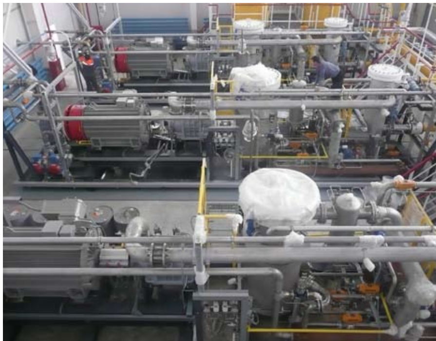
Фото 2. ДКС Enerproject на открытой раме (Рогожниковское месторождение)

инженеров ENERPROJECT group и высоким требованиям к качеству используемых материалов. В зависимости от состава попутного газа выбираются специальная сталь для газового трубопровода и сосудов высокого давления, марка масла, типы фильтров-картриджей для входного и коалесцентных фильтров. ДКУ ENERPROJECT надежно работают в составе газотурбинных электростанций Конитлорского, Западно-